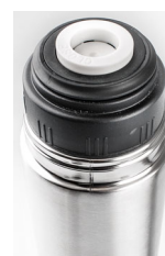
Válvula de seguridad