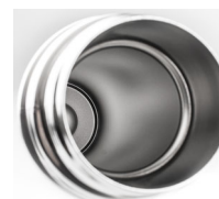
Interior acero inox SS304