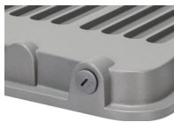
Válvula de presión y ventilación

Conexión directa a 185-265V. Chip LED SAMSUNG en el interior. IP65, conexiones totalmente estancas. Apertura de luz no inferior a 120°. Temperatura de luz fría (6500K). Válvula de presión y ventilación incorporada. Cubierta de cristal con acabado claro. Cuerpo de aluminio de color gris. Ahorran hasta un 90% de energía. Encendido electrónico instantáneo. Sujeción por medio de soporte.