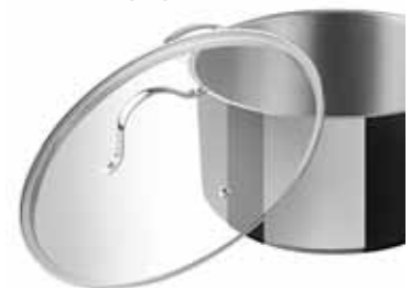
BORDE ACERO INOXIDABLE