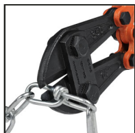
Corte de cadenas