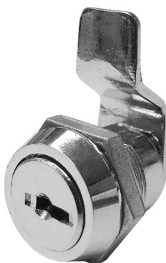
CURVA EQUIVALENCIA C111A IFAM