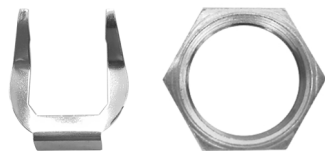
Leva con tuerca