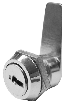
RECTA EQUIVALENCIA C111C IFAM