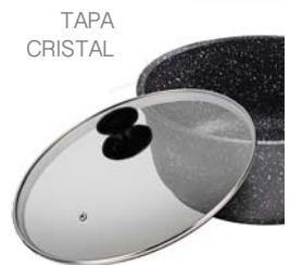
BORDE ACERO INOXIDABLE