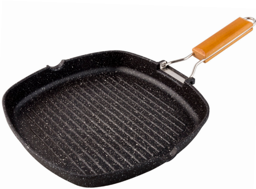
MANGO ABATIBLE MADERA