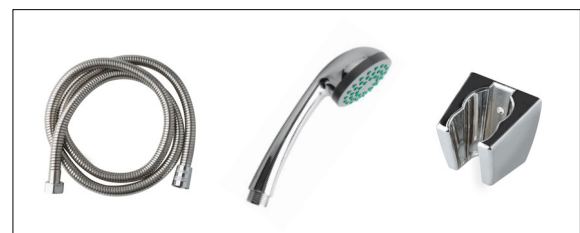
Incluye flexo, mango y soporte