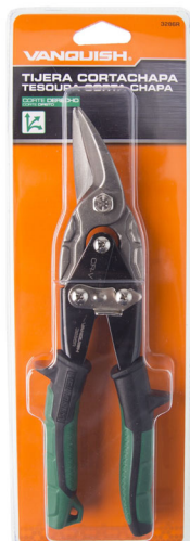
Presentación en blíster